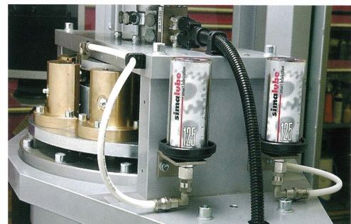
食品工場でのホースを使用した取り付け例 Example installation in a food factory using hoses

The grease (oil) in the cartridge is automatically supplied to the bearings using the H 2 gas pressure generated by the batteries.